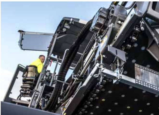
HÖHENVERSTELLBARE PLATTFORM FÜR EINEN BESSEREN ÜBERBLICK