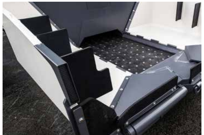
GRÖßER TUNNELQUERSCHNITT FÜR GROßE MATERIALMENGEN

Die großen, pendelnd aufgehängten Schubrollen mit Abstreifern ermöglichen ein schnelles Andocken der LKW für eine rasche Mischgutzufuhr. Mit der neuen TruckAssist-Funktion ist die Kommunikation zwischen dem Fahrer des Beschickers und dem LKW-Fahrer spielend einfach. Der Bediener kann seinen Sitz auf beiden Seiten des Beschickers ausschwenken sowie die Position des Bedienpults wunschgemäß einstellen. So hat er eine sehr gute Sicht auf den LKW, das Förderband und den Straßenfertiger. Durch den Automatikmodus mit Abstandsensorik und Füllstandsüberwachung wird gewährleistet, dass alle wichtigen Beschickerooperationen reibungslos und stressfrei durchgeführt werden können.